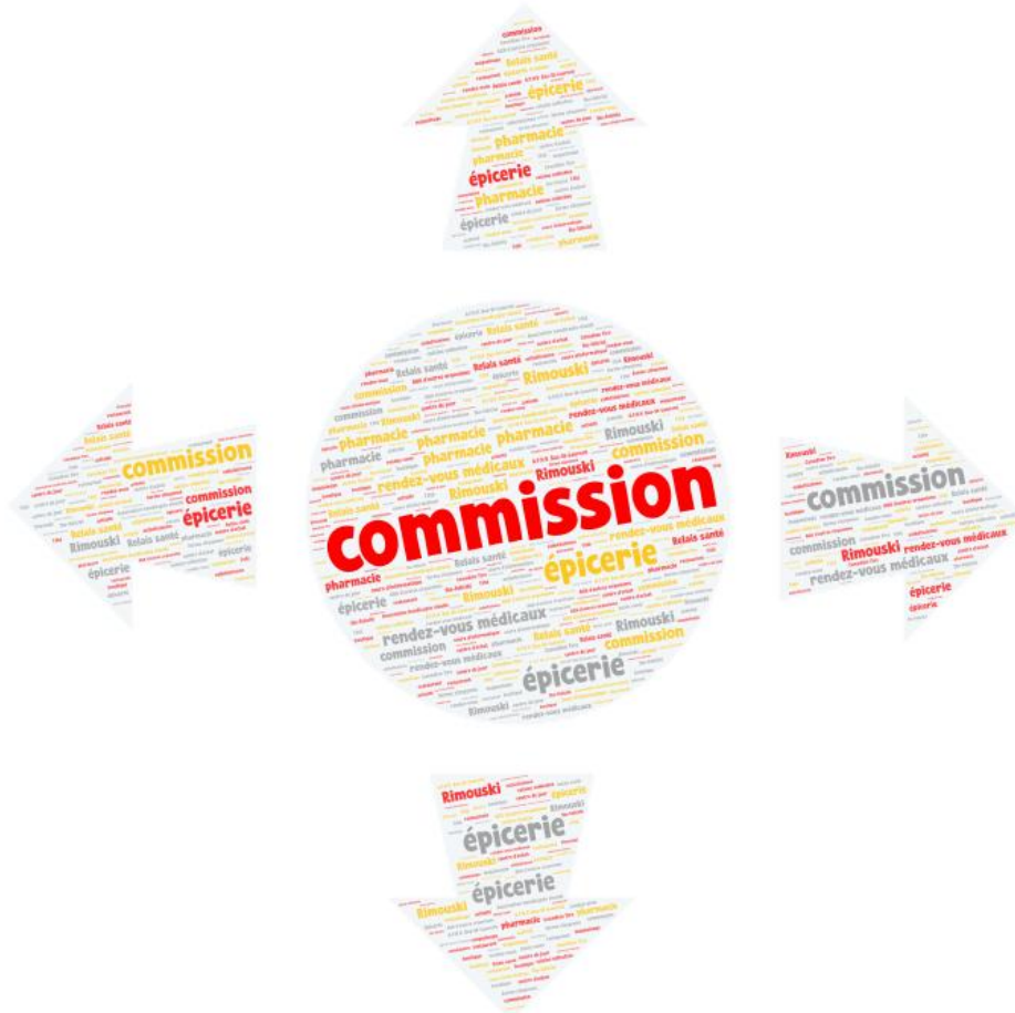
Figure 4 - Nuage de mot formé des activités effectuées grâce au service